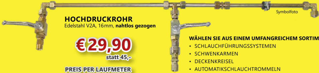
HOCHDRUCKROHR Edelstahl V2A, 16mm, nahtlos gezogen