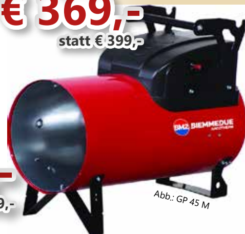
Abb.: GP 45 M