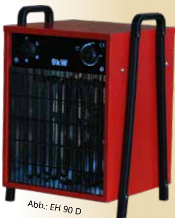
Abb.: EH 90 D